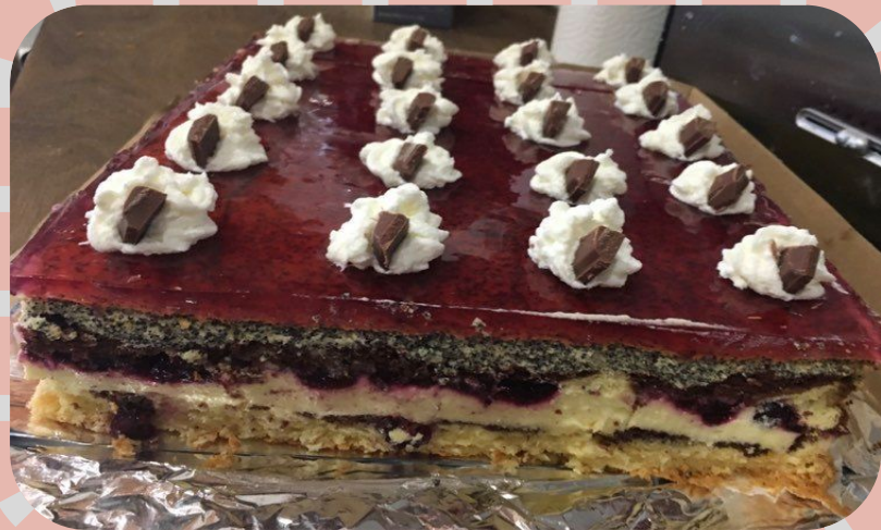
Ciasto makowo - kokosowe